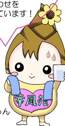
幸風苑の水飲みこうちゃん

戦後の復興期、高度成長期を牽引して下さった皆様。健康維持のために毎日の散歩や軽い筋トレ、骨密度検査をお勧めします！転ばないように気をつけましょう！