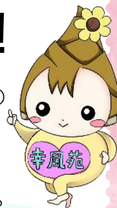
幸風苑の指差しこうちゃん

南河原地区と神明町（幸風苑地域包括支援センターの担当エリア）の住民さんは全員で 32,265人 ！（令和5年3月現在 幸区調査より）地域の全ての方にお元気でお過ごし頂けるよう、今号は各世代ごとに健康維持の秘訣をお伝えします。